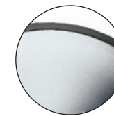
Brushed Chrome Chrome brossé