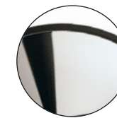
Mirrored Chrome Chrome grand brillant