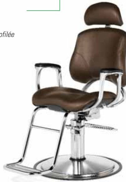
B1487 DU212 Chocolate (DU64) Chocolat DU212 (DU64)

Hydraulic Base Finishes / Finis pour base hydraulique