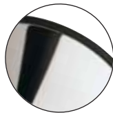
Mirrored Chrome Chrome grand brillant