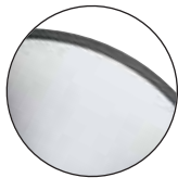
Brushed Chrome Chrome brossé

Hydraulic Base Finishes / Finis pour base hydraulique