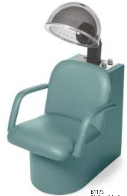
B1173 36 Capri/Menthe LEATHERITE

Hydraulic Base Finishes / Finis pour base hydraulique