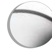
Brushed Chrome Chrome brossé