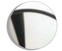
Mirrored Chrome Chrome grand brillant