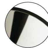
Mirrored Chrome Chrome grand brillant