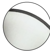
Brushed Chrome Chrome brossé