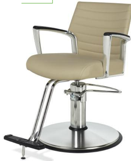
B1380 A31E Light Parchment / Parchemin A31E