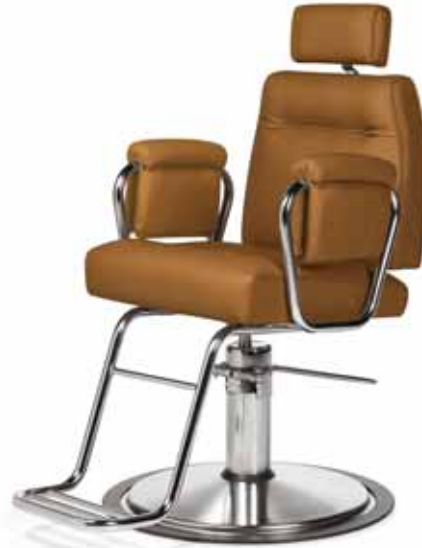
B6006 5033 Camel Softhide Softhide en chameau 5033

Hydraulic Base Finishes / Finis pour base hydraulique