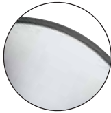
Brushed Chrome Chrome brossé

Hydraulic Base Finishes / Finis pour base hydraulique